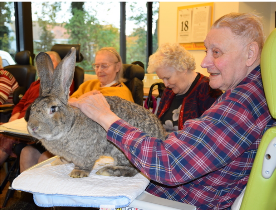
Activiteiten in het woonzorgcentrum