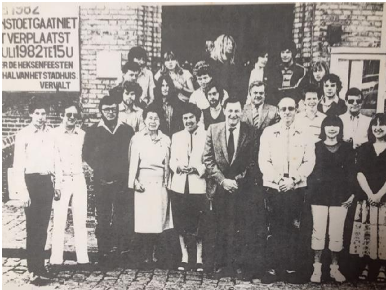
De eerste milieuraad. Door de affiche op achtergrond te dateren in 1982.