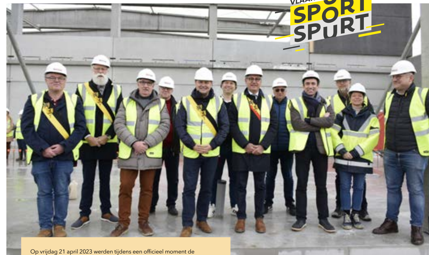
Op vrijdag 21 april 2023 werden tijdens een officieel moment de vorderingen van het project in de kijker geplaatst in aanwezigheid van het stadsbestuur en alle betrokken partijen.

Mits onvoorziene weers- en werfomstandigheden bereiken de voornaamste bouwwerken het eindpunt in het najaar van 2023. Vanaf dan start de afwerkingsfase waarbij de binneninrichting en alle technieken worden uitgevoerd.