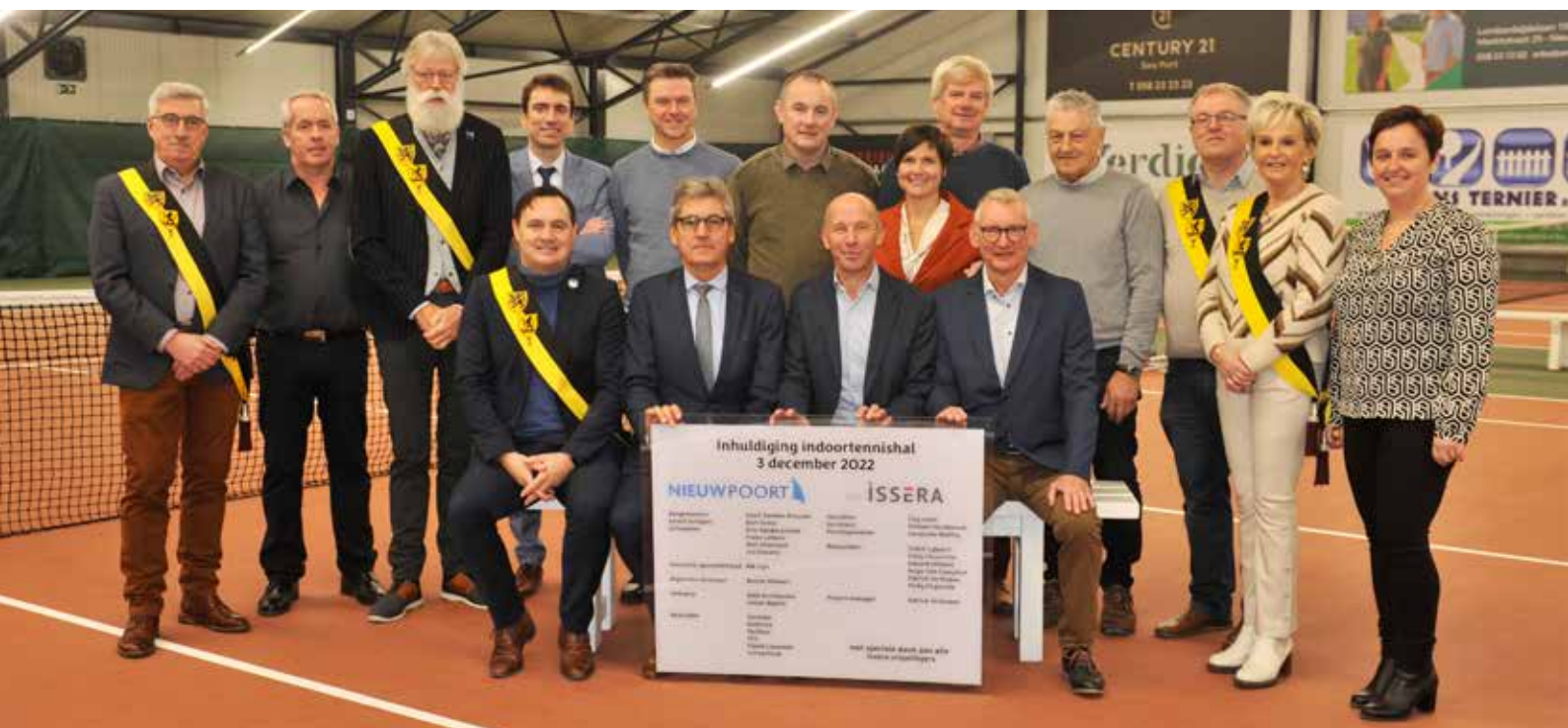
De indoor tennishal werd ingehuldigd op zaterdag 3 december 2022.

Heel groot, vooral in de Westhoek. Wanneer je keek naar het aantal leden in de Westhoek ten opzichte van het aantal beschikbare binnenterreinen, bleek dat er maar één terrein was per 600 spelers. Samen met de andere clubs in de regio hebben we geprobeerd om dit tekort in te vullen. En daarin zijn we geslaagd. Naast Nieuwpoort is er nu ook binnenaccommodatie beschikbaar in Koksijde en Diksmuide. Veurne heeft ondertussen ook plannen voor een indoorhal. De nood blijkt ook uit het feit dat de bezettingsgraad van onze indoorhal al heel hoog ligt, en dit pas enkele maanden na de opening.