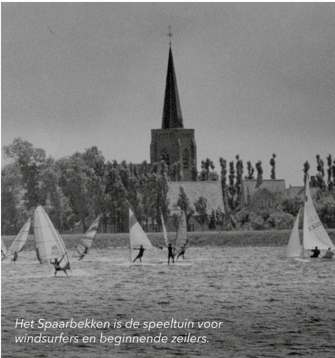
Het Spaarbekken is de speeltuin voor windsurfers en beginnende zeilers.

Voor deze NUS doken we in het Nieuwpoorts sportarchief en selecteerden een aantal sportbeelden uit vervlogen tijden.